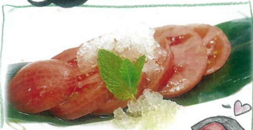
飛騨トマトの 冷しおでん